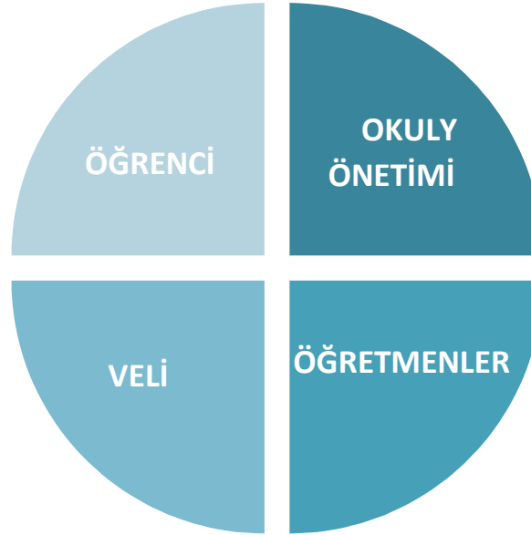
Şekil 1: Okul Temel Paydaşları

İlkokulu, faaliyetleriyle ilgili sunulan hizmetlere ilişkin memnuniyetlerin saptanması, kurumailişkin beklentiler, kurumailişkin durum tespiti, kurumsal işbirliği ve eşgüdüm, GZFT, önerilerin tespiti vb. konular hakkında İlkadım İlkokulu Stratejik Planlama Ekibi ile toplantılar düzenlenmiş ve kurumumuzun temel paydaşları olan öğrenci, veli ve öğretmenlerin görüş ve önerilerini almak üzere görüşme ve anket yöntemi uygulanmıştır.